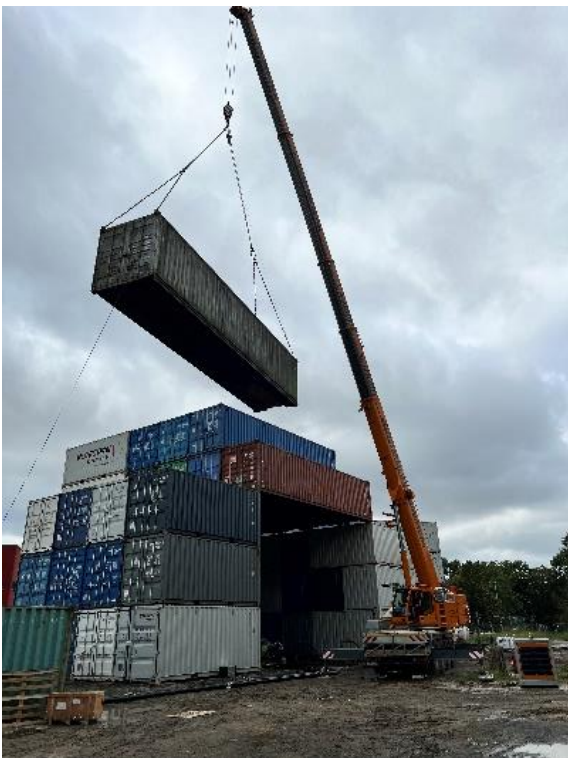
Abbildung 10: Container-Bauwerk

Im Jahr 2023 konnten in zwei weiteren Maßnahmen vier Blindgänger kontrolliert gesprengt und zahlreiche Zerscheller geborgen werden. Die erstmalig in diesem Umfang verwendeten Container-Bauwerke verhinderten großen Schaden. Jedes Bauwerk besteht dabei aus 49 20-Fuß-Containern und acht 40-Fuß-Containern, die zusätzlich mit 65 Wassersäcken (je 24.000 Liter) befüllt sind.