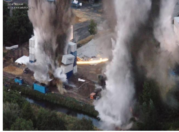
Abbildung 9: Zeitpunkt der Sprengung

Im Jahr 2023 konnten in zwei weiteren Maßnahmen vier Blindgänger kontrolliert gesprengt und zahlreiche Zerscheller geborgen werden. Die erstmalig in diesem Umfang verwendeten Container-Bauwerke verhinderten großen Schaden. Jedes Bauwerk besteht dabei aus 49 20-Fuß-Containern und acht 40-Fuß-Containern, die zusätzlich mit 65 Wassersäcken (je 24.000 Liter) befüllt sind.