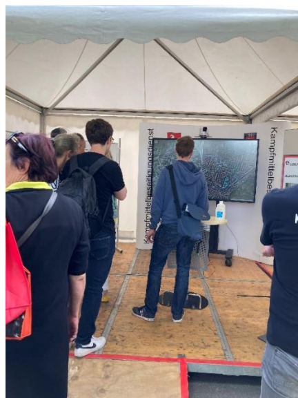
Abbildung 2: Impressionen vom Tag der Niedersachsen 2022

Am Tag der Niedersachsen in der Landeshauptstadt Hannover vom 10. bis 12.06.2022 und auf den Blaulichtmeilen 2022 und 2023 informierte der KBD über die Arbeit der Kriegsflutbildauswertenden. In einer interaktiven Karte konnten sich die Bürger und Bürgerinnen ein Bild von der Zerstörung der Landeshauptstadt machen. Die Mitarbeiter des Außendienstes veranschaulichten anhand zahlreicher Exponate die Funktionsweise der verschiedenen Kampfmittel.