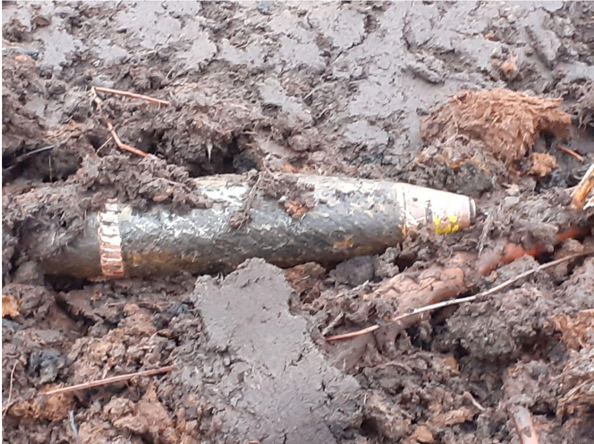
Abbildung 4: Fundmunition, Britische Granate (25 pdr, 8,76 cm), sehr guter Erhaltungszustand, Fund im Moorgebiet

Insgesamt wurden im Jahr 2022 über 227 Tonnen Kampfmittel durch den KBD geborgen, im Jahr 2023 knapp 164 Tonnen. Die deutliche Steigerung gegenüber den Vorjahren ist u.a. auf einige größere Räumprojekte zurückzuführen, folgt aber auch der allgemeinen Tendenz der Vorjahre und der wachsenden Zahl angemeldeter Räumstellen.