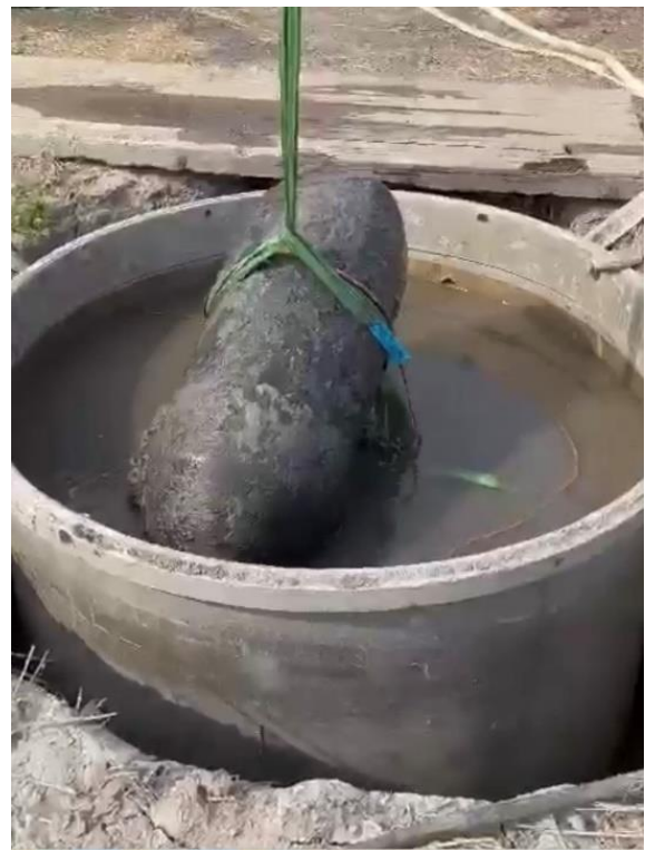
Abbildung 6: Bergung der Bombe

Bei dem Tauchereinsatz wurde der KBD durch die Technische Einsatzeinheit der Polizei aus Oldenburg unterstützt. Diese stellt Spezialtechnik und Unterstützungspersonal bei Tauchereinsätzen des KBD und ermöglicht so ein sicheres Arbeiten der Taucher.