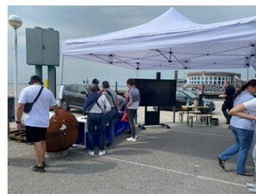
Abbildung 3: Impressionen Maritime Blaulichtmeile