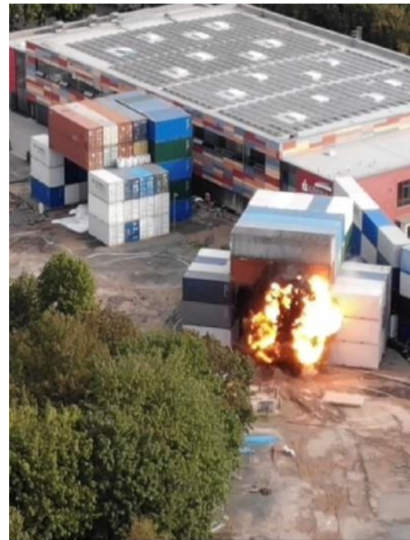
Abbildung 11: Sprengung