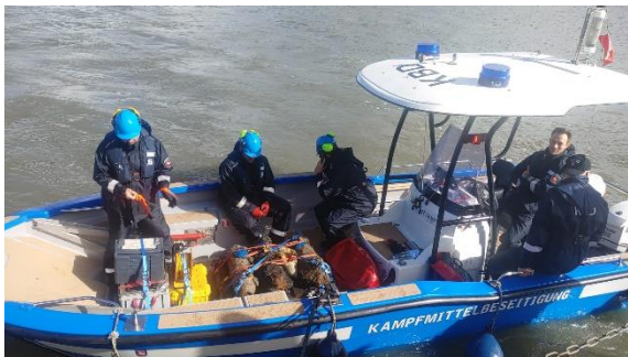
Abbildung 12: Bergungsboot mit Bomben an Bord

Für den KBD hatte dies einen sehr aufwendigen und zeitintensiven Einsatz zur Folge. An insgesamt sechs aufeinander folgenden Tagen wurden die Bomben einzeln geborgen, auf See übergeben und mit dem Bergungsboot des KBD zur Störtebekerplate gebracht. Die Anzahl der Bomben pro Fahrt lag zwischen vier und sechs. Für die Arbeiten auf der Sandbank gibt es zwischen ablaufendem und wieder auflaufendem Wasser nur ein sehr kleines Zeitfenster. Die Kampfmittel müssen zügig ausgeladen, zur Sprengung vorbereitet und gesprengt werden bevor das Wasser die Sandbank wieder überspült. Ein Einsatz auf See erfordert aufgrund des Wetters, des Seegangs und insbesondere der Gezeiten der Nordsee eine intensive Vorbereitung und stellt hohe Anforderungen an die Beschäftigten des KBD.