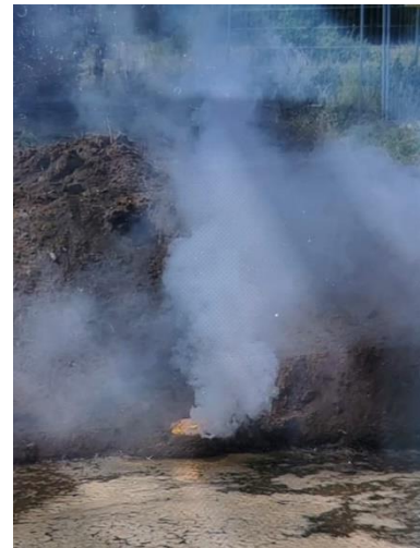
Abbildung 14: Unter starker Rauchentwicklung brennende Brandbombe

In den Jahren 2022 und 2023 gab es keine Personenschäden bei den Beschäftigten des KBD.