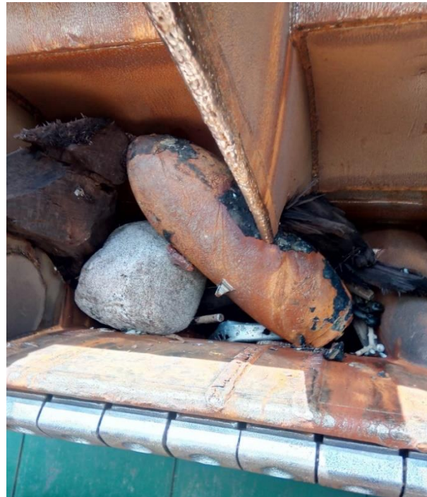
Abbildung 7: Britische Bombe im Arm des Saugbaggers

Im Jahr 2022 kam es zu insgesamt zehn Munitionsfundmeldungen auf Saugbaggern im Bereich der Außenelbe vor Cuxhaven. Dabei wurde Fundmunition im Gesamtgewicht von 678 kg geborgen und der Vernichtung zugeführt. Auch 2023 kam es zu weiteren Funden.