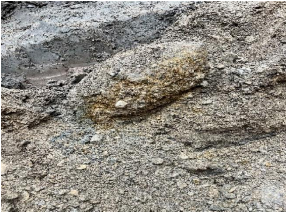
Abbildung 8: Bombe mit mineralischen Anhaftungen