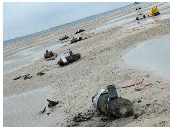
Abbildung 13: Bomben zur Sprengung vorbereitet

Alle 28 Bomben konnten so erfolgreich gesprengt werden. Für die Sprengungen auf der Sandbank wurden mit Unterstützung von drei Einsatzfahrzeugen und einem Bergungsboot von fünf Mitarbeitern rund 70 Arbeitsstunden je Einsatztag auf See geleistet. Nach sechs Tagen blicken die Beschäftigten des KBD auf eine der herausforderndsten Bergungen der letzten Jahre zurück.